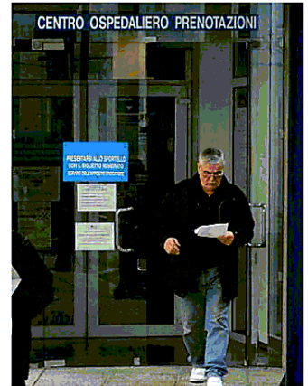
Il Centro prenotazioni al Ca' Foncello

>>> In tutto il Veneto si fermano le prestazioni sanitarie erogate dopo le 20, ossia 130 mila su 42 milioni (lo 0,5 per cento). A farne le spese sono soprattutto gli esami radiologici